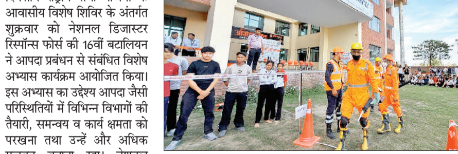
सोनीपत। गेटवे कॉलेज में आयोजित विशेष अभ्यास कार्यक्रम के दौरान नेशनल डिजास्टर रिस्पॉन्स फोर्स की टीम विद्यार्थियों को जानकारी देते हुए।

हरिभूमि न्यूज़ ▶ सोनीपत गेटवे कॉलेज में आयोजित सात दिवसीय राष्ट्रीय सेवा योजना के आवासीय विशेष शिविर के अंतर्गत विशेष अभ्यास कार्यक्रम का आयोजन