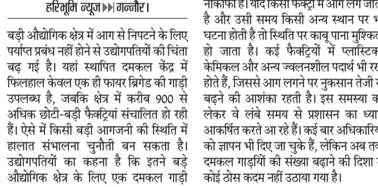
बड़ी औद्योगिक क्षेत्र में आग से निपटने के लिए पर्याप्त प्रबंध नहीं होने से उद्योगपतियों की चिंता बढ़ गई है। यहां स्थापित दमकल केंद्र में फिलहाल केवल एक ही फायर ब्रिगेड की गाड़ी उपलब्ध है, जबकि क्षेत्र में करीब 900 से अधिक छोटी-बड़ी फैक्ट्रियां संचालित हो रही हैं। ऐसे में किसी बड़ी आगजनी की स्थिति में हालात संभालना चुनौती बन सकता है। उद्योगपतियों का कहना है कि इतने बड़े औद्योगिक क्षेत्र के लिए एक दमकल गाड़ी