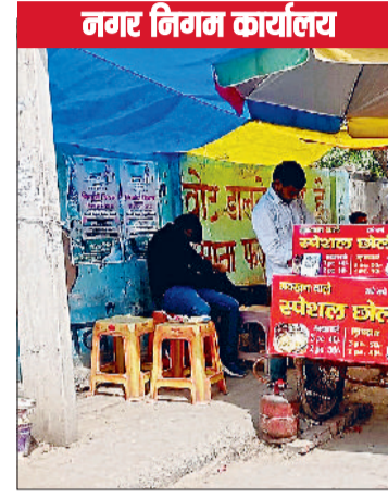
नगर निगम कार्यालय