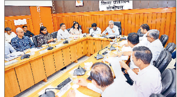
सोनीपत। बैठक में उपस्थित अधिकारीगण।

विकास कार्यों की समीक्षा की। उन्होंने नगर निगम और संबंधित विभागों को निर्देश दिए कि प्रमुख सड़कों, बाजारों और अधिक यातायात वाले क्षेत्रों में नियमित सफाई व्यवस्था बनाए रखें तथा ड्रेनों की गिरावनी भी सुनिश्चित करें। बैठक में रिठाला-नरेला-कुंडली मेट्रो और आरआरटीएस परियोजनाओं की प्रगति की समीक्षा करते हुए उन्होंने संबंधित अधिकारियों को कार्य में तेजी लाने के निर्देश दिए, ताकि