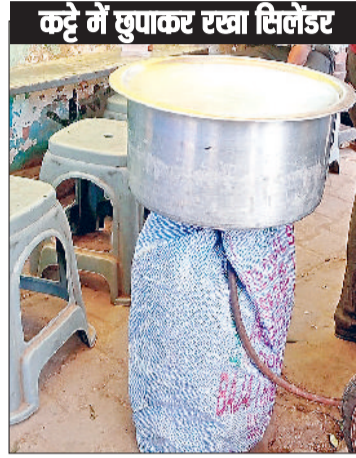
कट्टे में घुपाकर रखा सिलेंडर