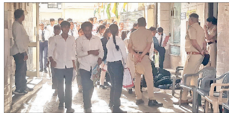
सोनीपत। गीता भवन चौक पर बने केंद्र पर परीक्षा देकर बाहर आते विद्यार्थी।

दो परीक्षा केंद्रों पर वीरवार को 6 नकल के मामले सामने आने पर रही शुक्रवार को सख्ताई हरिभूमि न्यूज़ ▶ सोनीपत